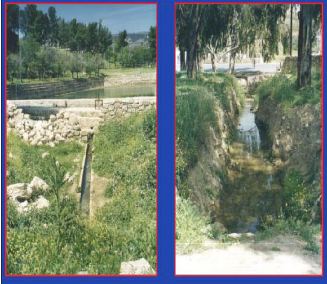
Plate (Photo) 1. A Photo of Qantara Spring Watershed